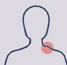
Ganglios linfáticos inflamados